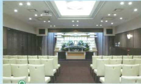
中ホール「飛天」●椅子席: 60~80席