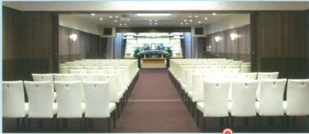
大ホール「飛天・山水」●椅子席: 80~120席