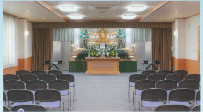
小ホール「飛翔」●椅子席: 50~80席