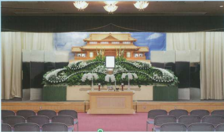
中ホール「飛天」●椅子席: 80~120席