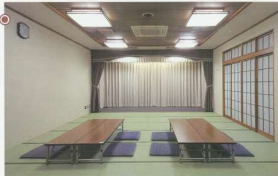
式場・控室「山水」●24畳