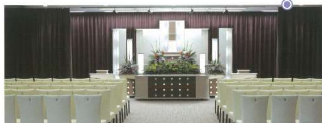
小ホール「飛翔」●椅子席:50~80席