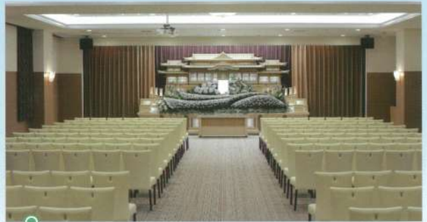
中ホール「飛天」●椅子席:100~140席