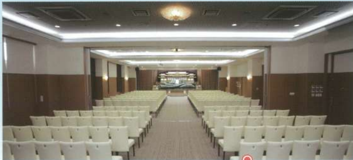
大ホール「飛天・山水」●椅子席:200~280席