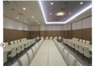
ミニホール「山水」●椅子席:30~50席 会食室「山水」●椅子席:50~70席