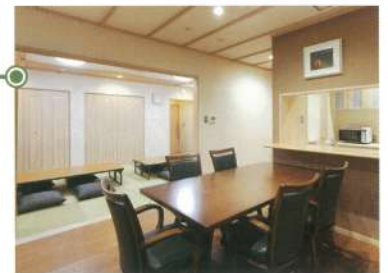
控室「飛天」リビング●12畳

お通夜から葬儀・法要・会席にいたるまで、当会館内にて行えますので、天候や時間の心配が不要です。 また、家族葬・個人葬・社葬・団体葬とすべての葬儀に対応できるお部屋をご用意しております。