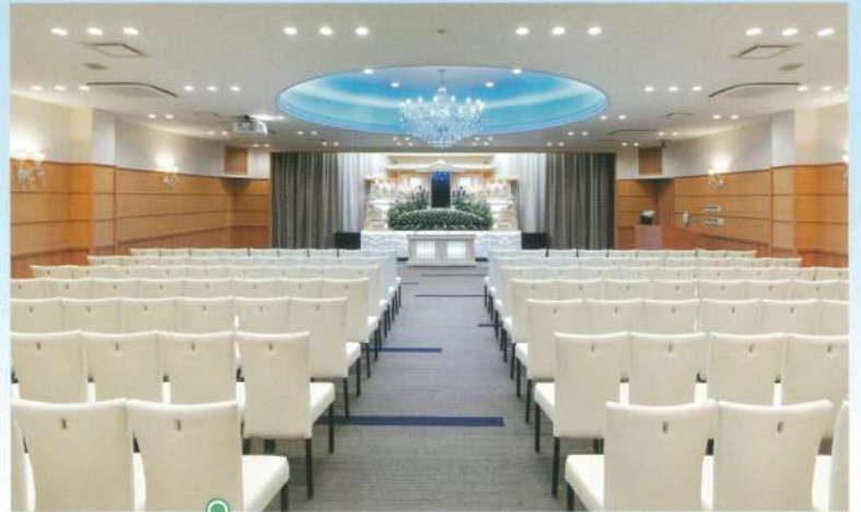
中ホール「飛天」●椅子席:80~120席