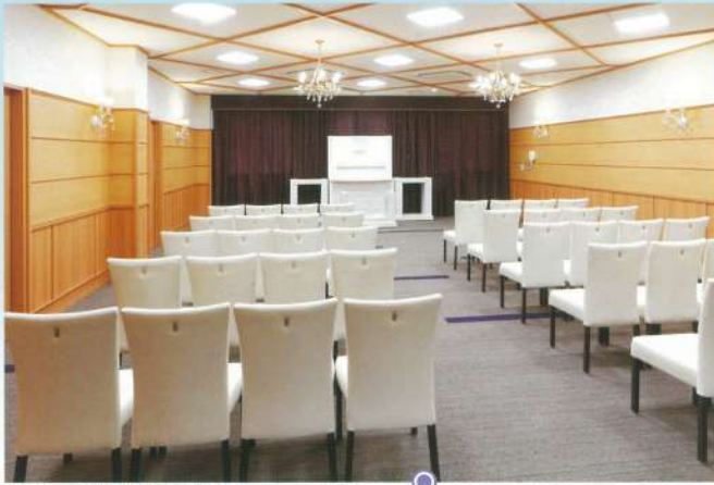
小ホール「飛翔」●椅子席:50~80席