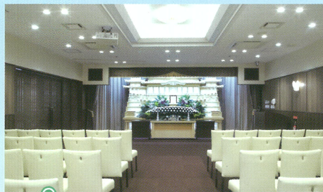
中ホール「飛天」●椅子席:60~80席