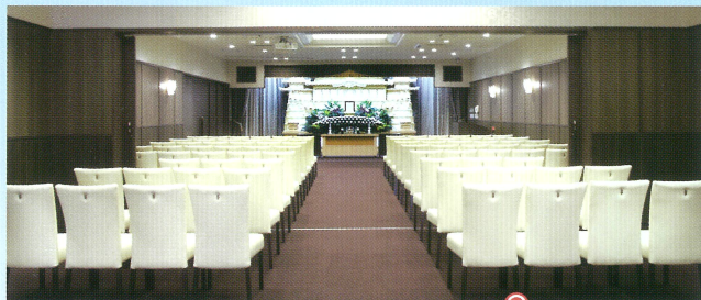
大ホール「飛天・山水」●椅子席:80~120席