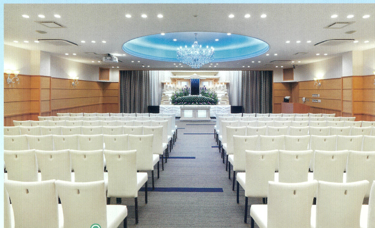
中ホール「飛天」●椅子席:80~120席