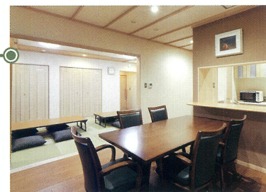
控室「飛天」リビング●12畳

お通夜から葬儀・法要・会席にいたるまで、当会館内にて行えますので、天候や時間の心配が不要です。 また、家族葬・個人葬・社葬・団体葬とすべての葬儀に対応できるお部屋をご用意しております。