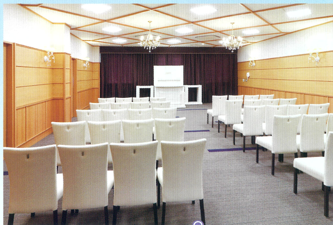
小ホール「飛翔」●椅子席:50~80席