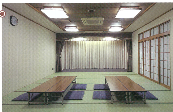
式場・控室「山水」●24畳