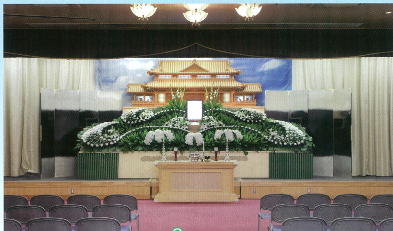
中ホール「飛天」●椅子席: 80~120席