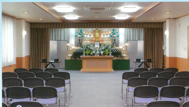
小ホール「飛翔」●椅子席: 50~80席