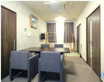
控室「清風」(和洋室)●10畳