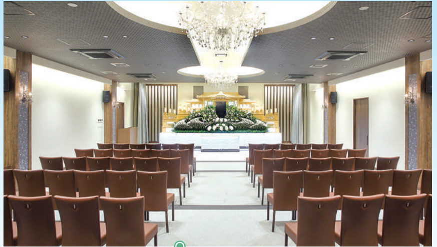
中ホール「飛天」●椅子席:80~130席