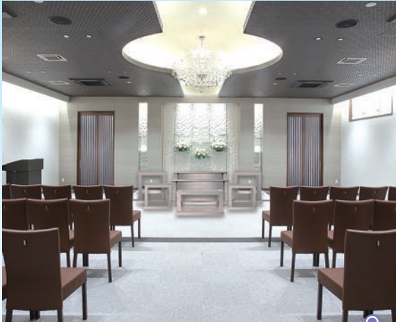
小ホール「飛翔」●椅子席:30~70席