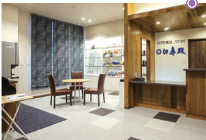
インフォメーション