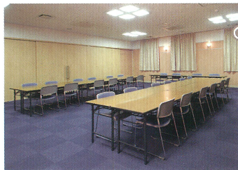
ミニホール「山水」●椅子席: 30~50席 会食室「山水」●椅子席: 40~60席