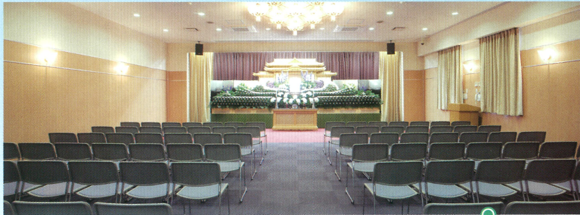
中ホール「飛天」●椅子席: 80~100席