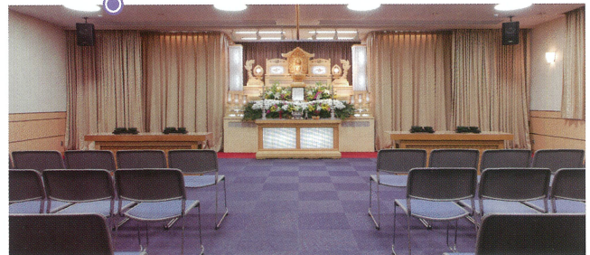
小ホール「飛翔」●椅子席: 50~80席

お通夜から葬儀・法要・会席にいたるまで、当会館内にて行えますので、天候や時間の心配が不要です。 また、家族葬・個人葬・社葬・団体葬とすべての葬儀に対応できるお部屋をご用意しております。