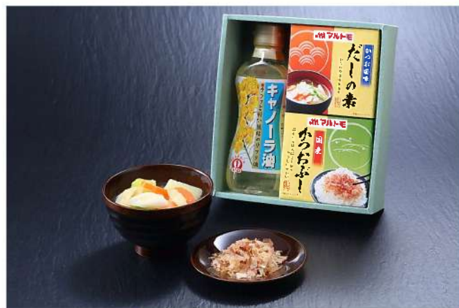
TNB-J キャノーラ油ギフト★

税込 1,134円 (税抜1,050円) キャノーラ油300g マルトモかつおぶし2g×4袋 マルトモだしの素4g×4袋