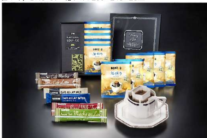
552-14 ドール・コーヒーセット★

税込 1,134円 (税抜1,050円) ドール ドリップバック深煎りブレンド×5P ドール インスタントスティック4種×各1P <泡立ちカフェラテ、カフェモカ ロイヤルミルクティー、泡立ち抹茶オレ> ドールカフェオレスティック2種×1P <まるやかカフェ・オレ、ほろにがカフェ・オレ>