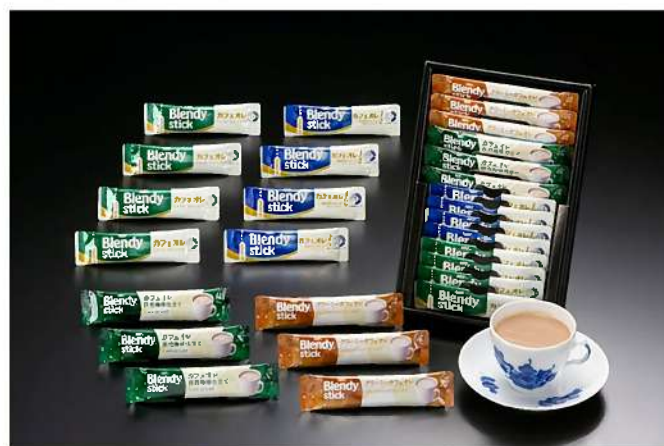
421-13 ブレンディカフェオレセット★

税込 1,134円 (税抜1,050円) AGFブレンディスティックカフェオレ×4P AGFブレンディスティックカフェオレカロリーーフ×4P ブレンディカフェオレ(深煎り)×3P ブレンディクリーミーカフェオレ×3P