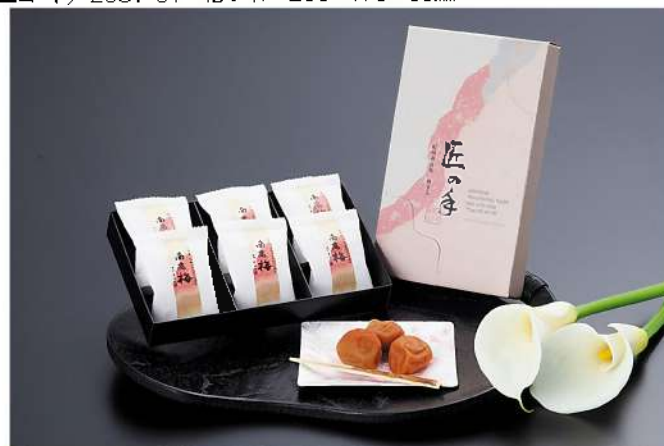
S10-U 匠の手 紀州南高梅★