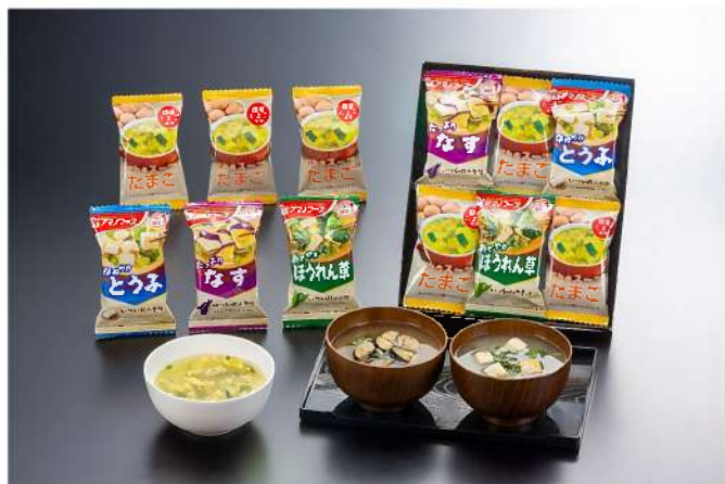
551-39 フリーズドライ みそ汁・スープセット★

税込 1,134円 (税抜1,050円) アマノフーズ フリーズドライみそ汁×各1袋 (なす、ほうれん草、とうふ) たまごスープ×3袋